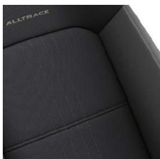
Тканевая обивка сидений "Alltrack"